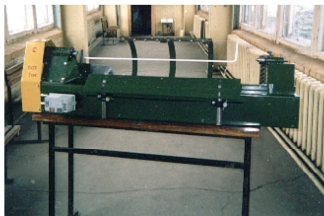
Токарный станок ДОС-Т1000 (настольное исполнение)