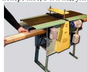
ПСР-А – рейсмусование на нижнем столе с автоматической подачей