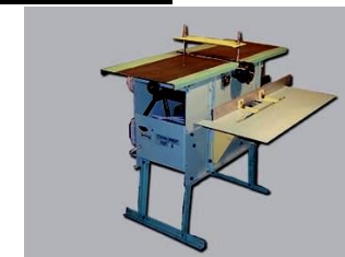
Горизонтальное фасонное фрезерование и сверление