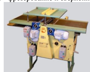
ПСР-А2 – двойное рейсмусование с двойной автоматической подачей