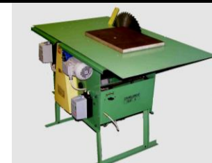
Пиление продольное и поперечное, в т.ч. под углом