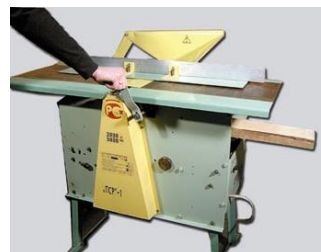
ПСР-1 – рейсмусование с механической подачей материала